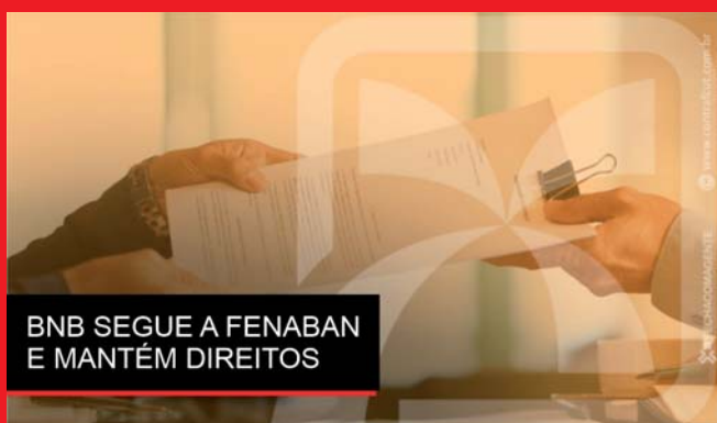
BNB SEGUE A FENABAN E MANTÉM DIREITOS

PROPOSTA APROVADA POR 89,8% VOTARAM 1083 BANCÁRIOS